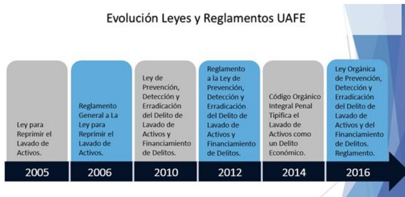
Figura 3. Evolución de Leyes y Reglamentos, Unidad de Análisis Financiero y Económico.

Esta ley crea en su Art. 11, a la Unidad de Análisis Financiero y Económico (UAFE) , como la entidad responsable de la realización de reportes y ejecución de las políticas en materia de prevención de lavado de activos, además es quien luego de analizar la información de operaciones inusuales, podrá remitir informe a la Fiscalía General del Estado (FGE). Así mismo el art. 16 de la misma Ley, contempla la creación de unidades complementarias para la prevención incluyendo entre estas a las Superintendencias, SRI, SENA, FGE, Policía Nacional y entre otras.