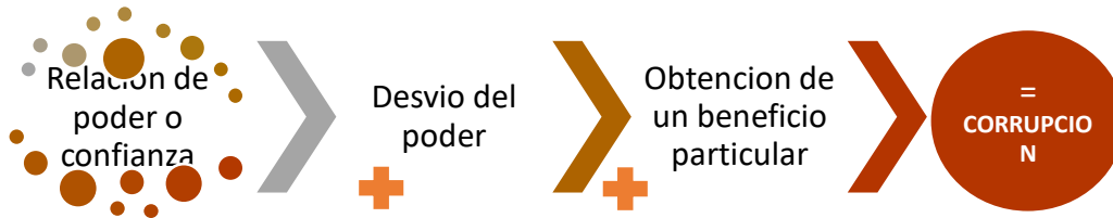
Figura 1. Elementos de la Corrupción, Derechos Reservados, 2015 “TIPOLOGÍAS DE CORRUPCIÓN”, Oficina de las Naciones Unidas contra la Droga y el Delito –UNODC– y la Alcaldía Mayor de Bogotá

Partiendo de estos elementos se puede clasificar la corrupción en 7 segmentos, según el análisis de la “Tipologías de Corrupción” de la Oficina de las Naciones Unidas contra la Droga y el Delito y la Alcaldía Mayor de Bogotá; pero que para fines del presente ensayo y del objetivo de análisis, aplicable a la realidad ecuatoriana, nos enfocaremos en 4 de ellos, que se presentan a continuación en la Figura 2.